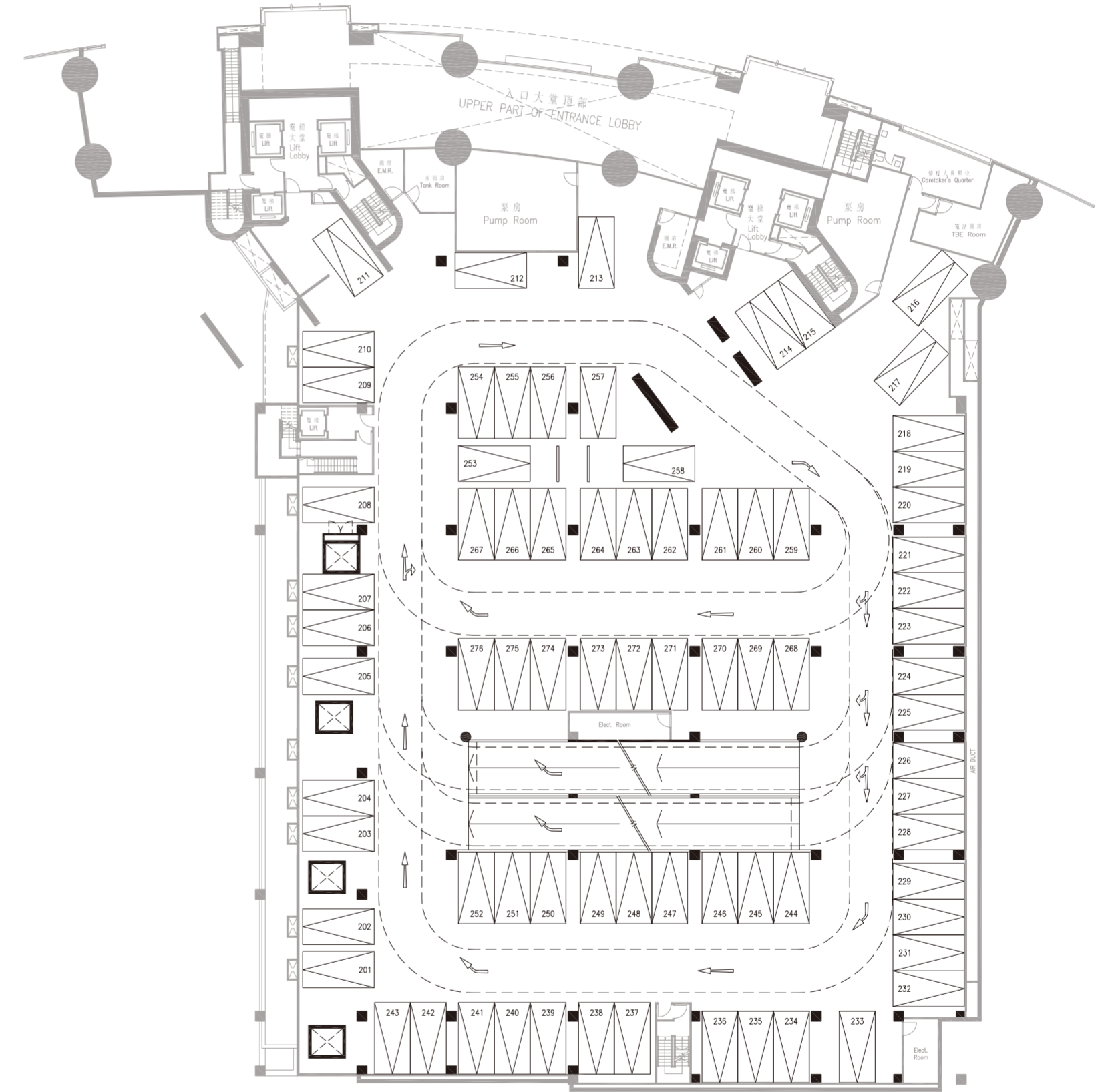
停車位數目及面積 Number and Area of Parking Spaces