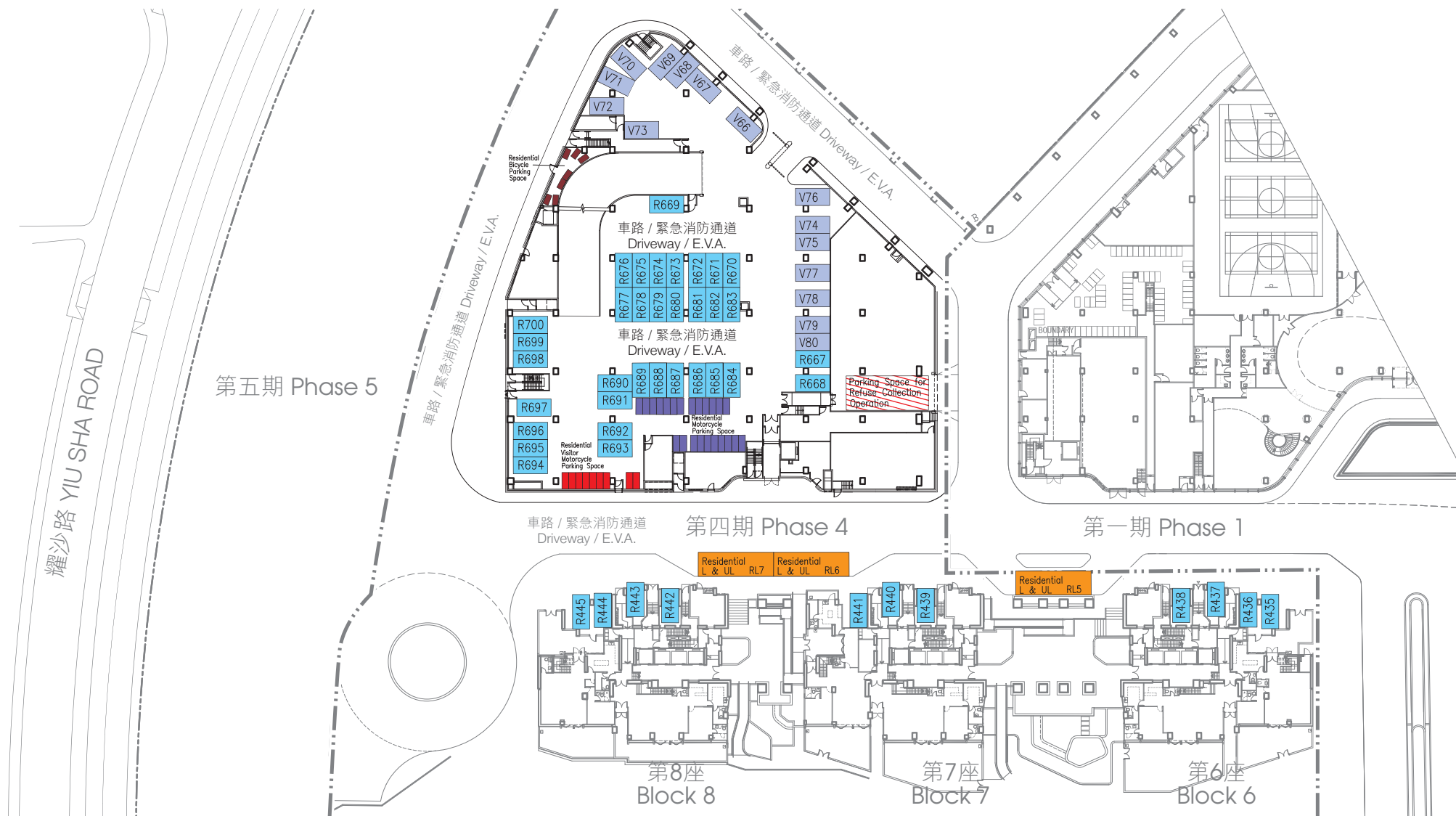
停車位數目及停車位面積 Number and Area of Parking Spaces