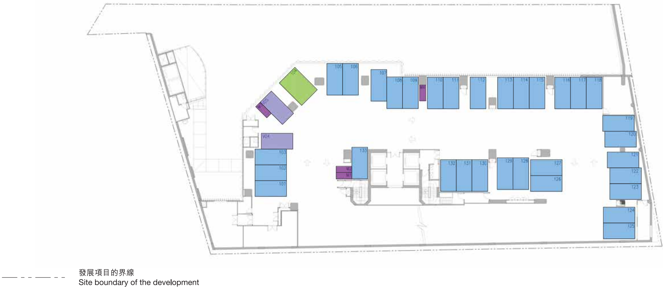
1樓平面圖 1/F FLOOR PLAN